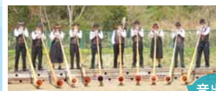
演奏：那須アルプホルンクラブ